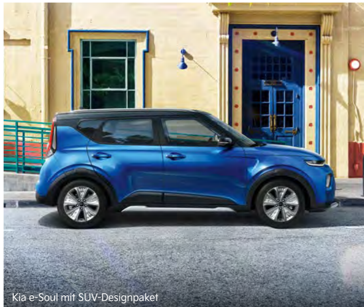
Kia e-Soul mit SUV-Designpaket