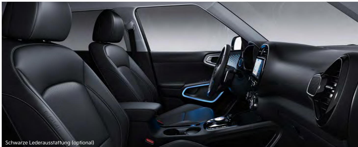
Schwarze Lederausstattung (optional)

Abbildungen zeigen kostenpflichtige Sonderausstattung.