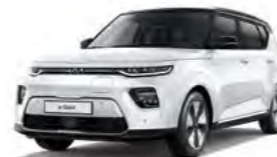
Schneeweiß mit Kontrastfarbe Schwarz (F1D)