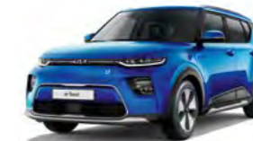
Neptunblau Metallic (B3A)