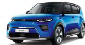
Neptunblau Metallic mit Kontrastfarbe Schwarz (FB1)