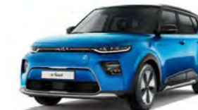
Surf Blue mit Kontrastfarbe Schwarz (FB3)