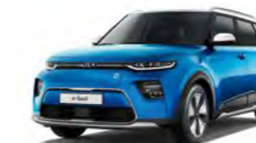
Surf Blue mit Kontrastfarbe Weiß (AH8)