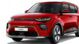
Infernorot Metallic (AJR)