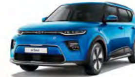
Surf Blue (SRB)