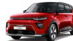
Infernorot Met. mit Kontrastfarbe Schwarz (FA2)