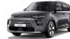
Gravitygrau Metallic (KDG)