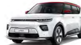
Schneeweiß mit Kontrastfarbe Rot (AH1)