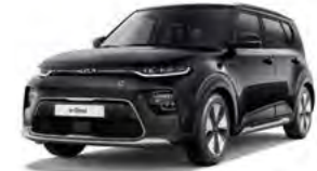
Fusion Black Metallic (FSB)