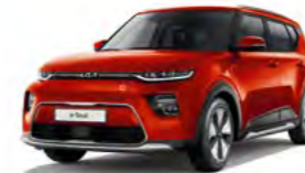
Marsorange Metallic (M3R)