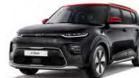
Fusion Black Met. mit Kontrastfarbe Rot (FA1)