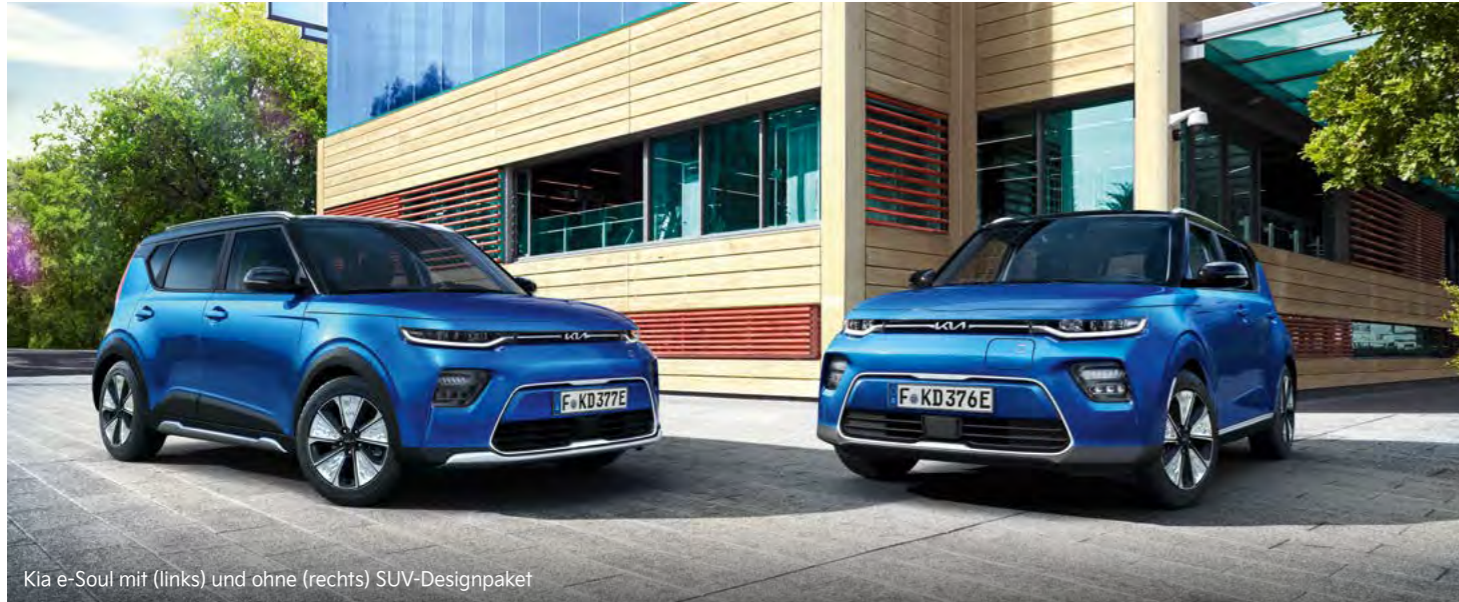
Kia e-Soul mit (links) und ohne (rechts) SUV-Designpaket

Frisch und unkonventionell: Der Kia e-Soul präsentiert sich mit einer außergewöhnlichen Formgebung, neuen Farben und Hightech-Details. Mit ihm hebst du dich von der Masse ab und zeigst deinen ganz eigenen Charakter.