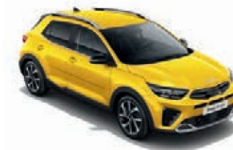
Floridagelb Met. (MYW)