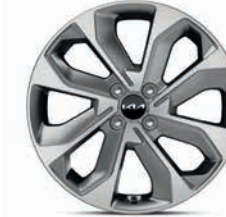
17-Zoll-Leichtmetallfelgen (Spirit und Platinum)