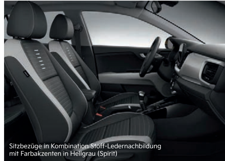
Sitzbezüge in Kombination Stoff-Ledernachbildung mit Farbakzenten in Hellgrau (Spirit)