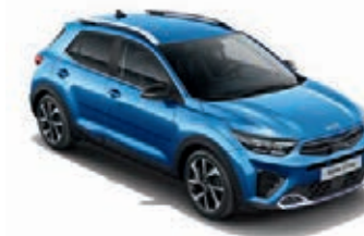
Bathysblau Met. (SPB)