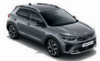
Perennialgrau Met. (PRG)