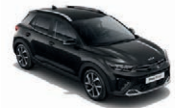
Auroraschwarz Met. (ABP)