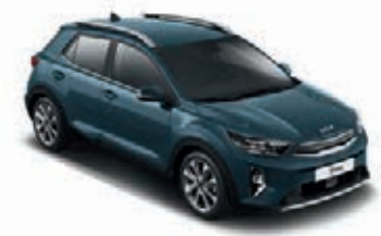
Denimblau Met. (EU3)