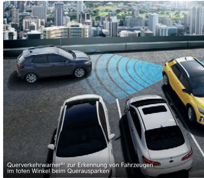
Querverkehrwarner A+ zur Erkennung von Fahrzeugen im toten Winkel beim Querausparken

Der Aktive Spurhalteassistent mit korrigierendem Lenkeingriff (Lane Keeping Assist, LKA) erkennt per Kamera, ob der Kia Stonic unbeabsichtigt seine Fahrspur verlässt. In dem Fall weist dich das System darauf hin und lenkt gleichzeitig geringfügig gegen, um das Fahrzeug in der Spur zu halten.