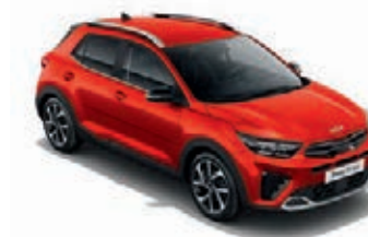
Signalrot Met. (BEG)