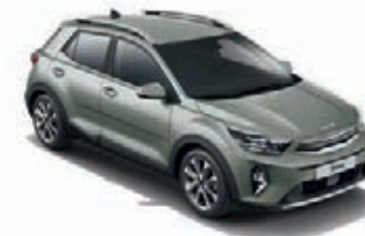
Urbangrün Met. (URG)