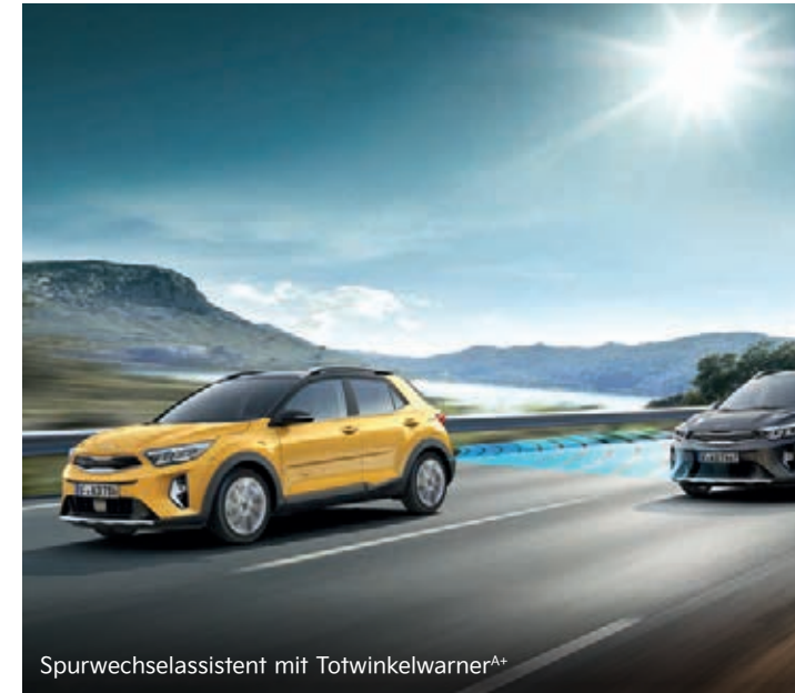
Spurwechselassistent mit Totwinkelwarner A+

Der Müdigkeitwarner (Driver Attention Warning, DAW) erkennt durch die Überwachung von Lenkrad, Blinker und Beschleunigungsmustern, ob deine Konzentration abbaut. Erkennt das System Anzeichen von Müdigkeit, schlägt es dir durch eine akustische Warnung und ein Kaffeetassen-Symbol in der Instrumenteneinheit eine Pause vor.