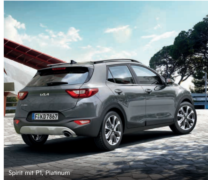
Spirit mit P1, Platinum