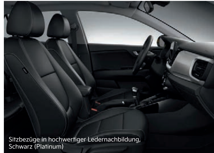
Sitzbezüge in hochwertiger Ledernachbildung, Schwarz (Platinum)

Abbildungen zeigen kostenpflichtige Sonderausstattung.