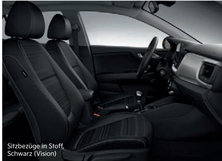
Sitzbezüge in Stoff, Schwarz (Vision)

Hier kannst du dich entspannen: Für den Kia Stonic stehen Sitzbezüge aus Stoff oder Stoff in Kombination mit Ledernachbildung zur Wahl. Die Version Platinum bietet dir Sitze aus hochwertiger Ledernachbildung.