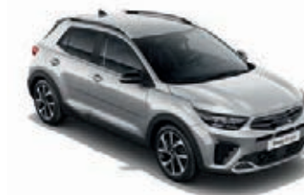
Seidensilber Met. (4SS)