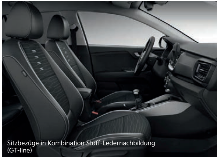
Sitzbezüge in Kombination Stoff-Ledernachbildung (GT-line)