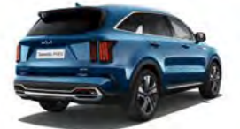
Mineralblau Metallic (M4B)