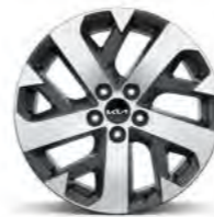
18-Zoll- Leichtmetallfelgen (für Vision Diesel)

Bei einigen unserer modernen Metallicfarben werden bewusst unterschiedliche Farbpigmente verwendet. Dadurch können unter bestimmten Lichtverhältnissen, z. B. direktes Sonnenlicht, attraktive Farbeffekte erzielt werden. Zum Teil kann die Farbe changieren, z. B. von Schwarz zu Dunkelblau. Bei den hier abgebildeten Farbdarstellungen kann es aufgrund der Drucktechnik zu Abweichungen zu den Originalfarben kommen. Weitere Informationen zu den Farbeffekten und Grundfarben erhältst du bei deinem Kia-Partner. Metalliclackierungen sind aufpreispflichtig.