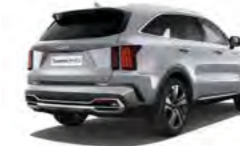
Seidensilber Metallic (4SS)