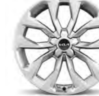
20-Zoll- Leichtmetallfelgen (für Platinum Diesel)

Detaillierte Informationen zum Kia Sorento findest du unter www.kia.com/de/broschuere . Dort kannst du dir auch die komplette Modellbroschüre herunterladen.