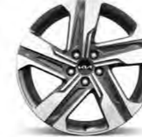
19-Zoll- Leichtmetallfelgen (für Plug-in Hybrid, Spirit Diesel und ab Vision Hybrid)