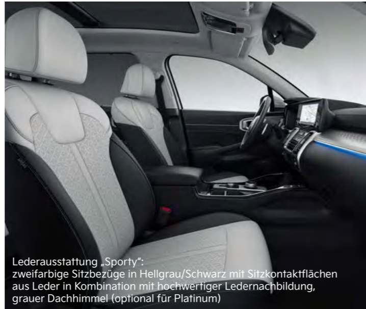
Lederausstattung „Sporty“: zweifarbige Sitzbezüge in Hellgrau/Schwarz mit Sitzkontaktf lächen aus Leder in Kombination mit hochwertiger Ledernachbildung, grauer Dachhimmel (optional für Platinum)