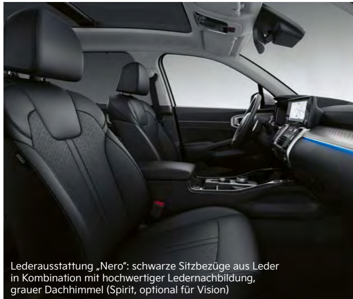
Lederausstattung „Nero“: schwarze Sitzbezüge aus Leder in Kombination mit hochwertiger Ledernachbildung, grauer Dachhimmel (Spirit, optional für Vision)