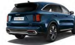
Gravity Blau Metallic (B4U)