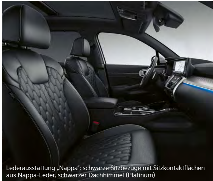
Lederausstattung „Nappa“: schwarze Sitzbezüge mit Sitzkontaktf lächen aus Nappa-Leder, schwarzer Dachhimmel (Platinum)

Das elegante und stilvolle Interieur des Kia Sorento wird dich überzeugen. Das Ausstattungsspektrum beinhaltet neben hochwertigen schwarzen Stoffsitzen drei verschiedene Ledervarianten: in Schwarz, zweifarbig in Schwarz-Hellgrau sowie in Schwarz mit Sitzkontaktf lächen in Nappa-Leder.