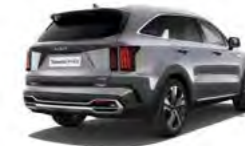
Stahlgrau Metallic (KLG)