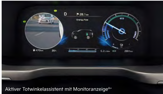
Aktiver Totwinkelassistent mit Monitoranzeige A+

Die modernen, intelligenten Assistenzsysteme helfen, das Fahren im Kia Sorento sicherer und entspannter zu machen.