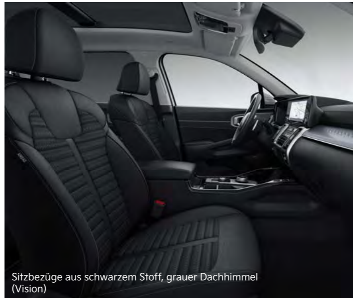
Sitzbezüge aus schwarzem Stoff, grauer Dachhimmel (Vision)

Abbildungen zeigen kostenpflichtige Sonderausstattung. Darstellung: Repräsentation für Sitzkonfiguration.