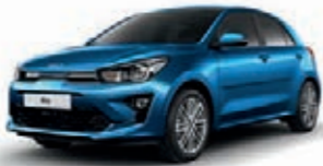
Bathysblau Metallic (SPB)