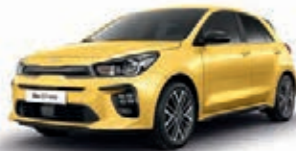
Floridagelb Metallic (MYW), nur für GT-line

Bei einigen unserer modernen Metallicfarben werden bewusst unterschiedliche Farbpigmente verwendet. Dadurch können unter bestimmten Lichtverhältnissen, z.B. direktes Sonnenlicht, attraktive Farbeffekte erzielt werden. Zum Teil kann die Farbe changieren, z.B. von Schwarz zu Dunkelblau. Bei den hier abgebildeten Farbdarstellungen kann es aufgrund der Drucktechnik zu Abweichungen zu den Originalfarben kommen. Weitere Informationen zu den Farbeffekten und Grundfarben erhältst du bei deinem Kia-Partner. Metalliclackierungen sind aufpreispflichtig.