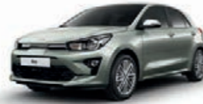
Urbangrün Metallic (URG) + , nicht für GT-line