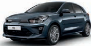
Denimblau Metallic (EU3) + , nicht für GT-line