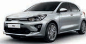
Seidensilber Metallic (4SS) + , nicht für GT-line