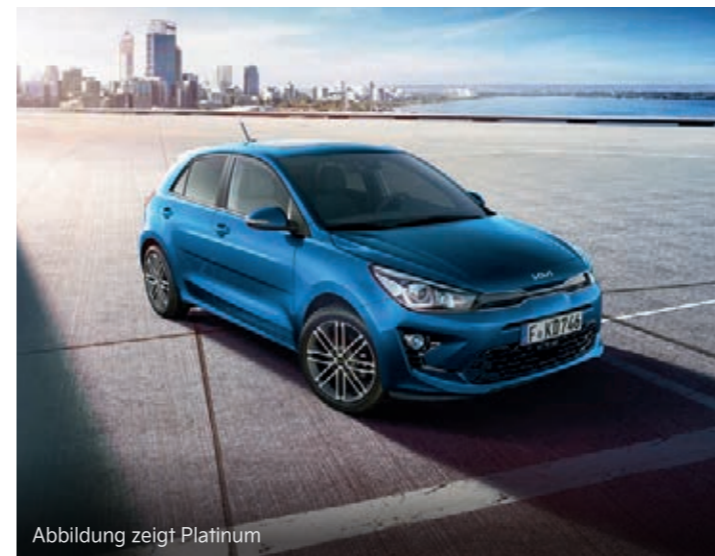
Abbildung zeigt Platinum