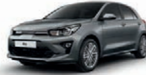
Perennialgrau Metallic (PRG)