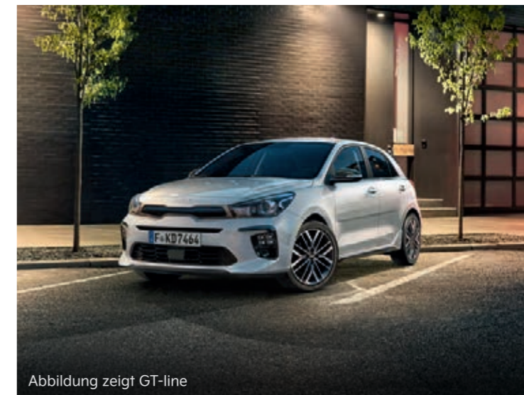
Abbildung zeigt GT-line

Abbildungen zeigen kostenpflichtige Sonderausstattung.