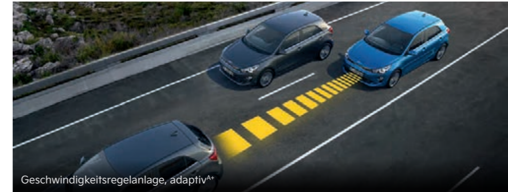
Geschwindigkeitsregelanlage, adaptiv A+

Per Kamera und Radar misst die adaptive Geschwindigkeitsregelanlage (Smart Cruise Control, SCC) A+ die Distanz zum vorausfahrenden Fahrzeug sowie dessen Geschwindigkeit. Wird der festgelegte Sicherheitsabstand unterschritten, bremst das System den Kia Rio ab. Nur für Doppelkupplungsgetriebe.