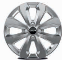
16-Zoll-Leichtmetallfelgen (Vision und Spirit)