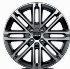
17-Zoll-Leichtmetallfelgen (Platinum, optional für Spirit)