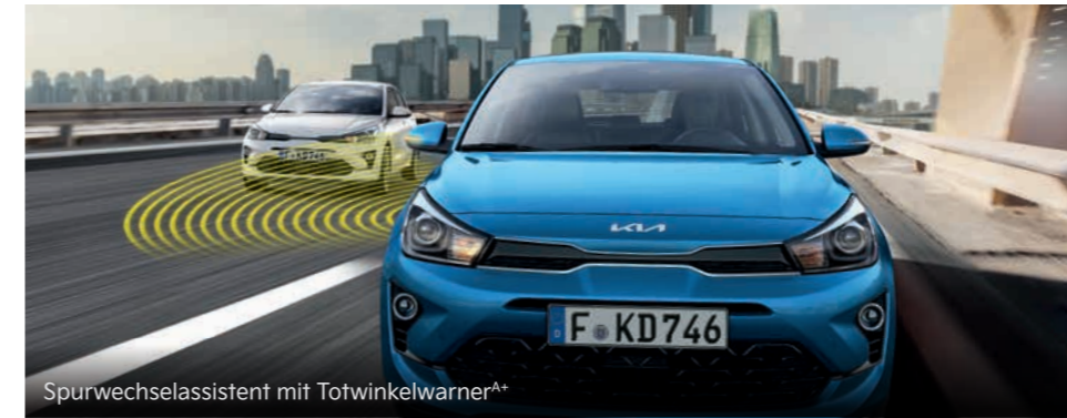
Spurwechselassistent mit Totwinkelwarner A+

Mit einem breiten Spektrum an aktiven Sicherheitssystemen A unterstützt dich der Kia Rio dabei, in Gefahrensituationen schnell und angemessen zu reagieren. Hier siehst Du einen Auszug. Ausführliche Informationen zu den Assistenzsystemen findest du in der Broschüre des Kia Rio unter www.kia.com/de/broschuere .