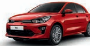
Signalrot Metallic (BEG)