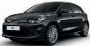
Auroraschwarz Metallic (ABP)