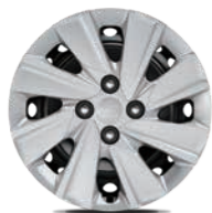
15-Zoll-Stahlfelgen (Edition 7)

Bei einigen unserer modernen Metallicfarben werden bewusst unterschiedliche Farbpigmente verwendet. Dadurch können unter bestimmten Lichtverhältnissen, z.B. direktes Sonnenlicht, attraktive Farbeffekte erzielt werden. Zum Teil kann die Farbe changieren, z.B. von Schwarz zu Dunkelblau. Bei den hier abgebildeten Farbdarstellungen kann es aufgrund der Drucktechnik zu Abweichungen zu den Originalfarben kommen. Weitere Informationen zu den Farbeffekten und Grundfarben erhältst du bei deinem Kia-Partner. Metalliclackierungen sind aufpreispflichtig.