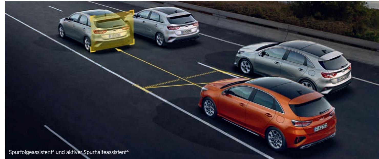
Spurfolgeassistent A und aktiver Spurhalteassistent A

Per Kamera und Radar misst die adaptive Geschwindigkeitsregelanlage (Smart Cruise Control, SCC) die Distanz zum vorausfahrenden Fahrzeug sowie dessen Geschwindigkeit. Wird der festgelegte Sicherheitsabstand unterschritten, bremst das System den Kia ProCeed ab, wenn nötig bis zum Stillstand. Die Stop&go-Funktion erweist sich besonders in stockendem Verkehr als hilfreich. Sobald die Verkehrssituation es zulässt, wird das Fahrzeug wieder auf die eingestellte Geschwindigkeit beschleunigt. Das System ist nur in Verbindung mit Doppelkupplungsgetriebe erhältlich.