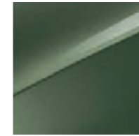
Experience Grün Metallic (EXG)

Bei einigen unserer modernen Metallicfarben werden bewusst unterschiedliche Farbpigmente verwendet. Dadurch können unter bestimmten Lichtverhältnissen, z.B. direktes Sonnenlicht, attraktive Farbeffekte erzielt werden. Zum Teil kann die Farbe changieren, z.B. von Schwarz zu Dunkelblau. Bei den hier abgebildeten Farbdarstellungen kann es aufgrund der Drucktechnik zu Abweichungen zu den Originalfarben kommen. Weitere Informationen zu den Farbeffekten und Grundfarben erhältst du bei deinem Kia-Partner. Metalliclackierungen sind aufpreispflichtig.