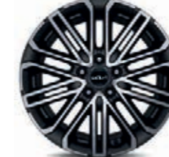
18-Zoll-Leichtmetallfelgen (optional für GT-line)