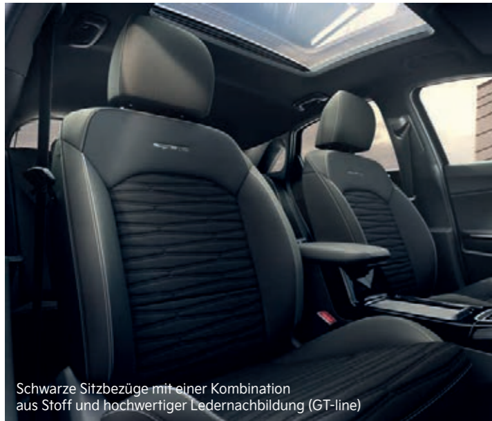
Schwarze Sitzbezüge mit einer Kombination aus Stoff und hochwertiger Ledernachbildung (GT-line)

Edles, sportliches Flair: Je nach Ausführung und Sonderausstattung verfügt der Kia ProCeed über Sitzbezüge in einer Kombination aus Stoff und hochwertiger Ledernachbildung oder über Sportsitze mit schwarzen Leder-Veloursleder-Bezügen, farblich abgesetzten Ziernähten (GT-line: Grau; GT: Rot) und entsprechend gestalteten Logos.