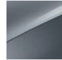
Lunarsilber Metallic (CSS)