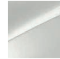
Deluxeweiß Metallic (HW2)