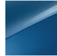
Blue Flame Metallic (B3L)