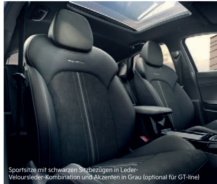
Sportsitze mit schwarzen Sitzbezügen in Leder-Veloursleder-Kombination und Akzenten in Grau (optional für GT-line)