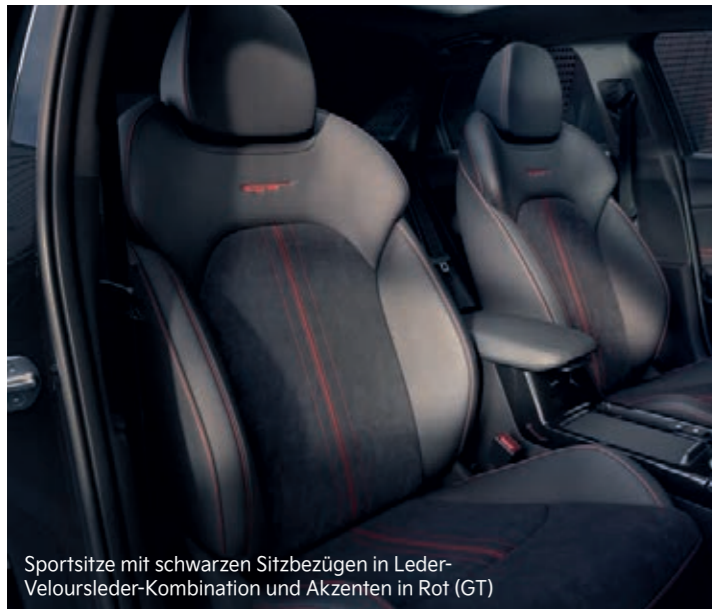
Sportsitze mit schwarzen Sitzbezügen in Leder-Veloursleder-Kombination und Akzenten in Rot (GT)