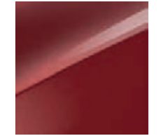
Infrarot Metallic (AA9)