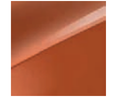
Orange Fusion Metallic (RNG)