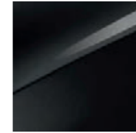
Zilinaschwarz Metallic (1K)