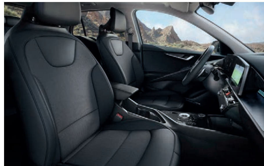
Sitzbezüge in Stoff-Leder- Kombination (mit hochwertiger Ledernachbildung), Charcoal (CCV) (Vision).