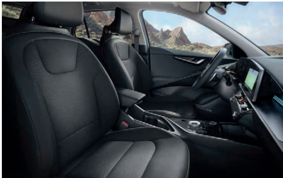
Sitzbezüge in hochwertiger Ledernachbildung, Charcoal-Grau (DFS) (optional für Spirit und Inspiration).