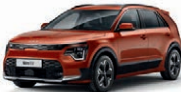
Delight Orange Metallic (DRG)