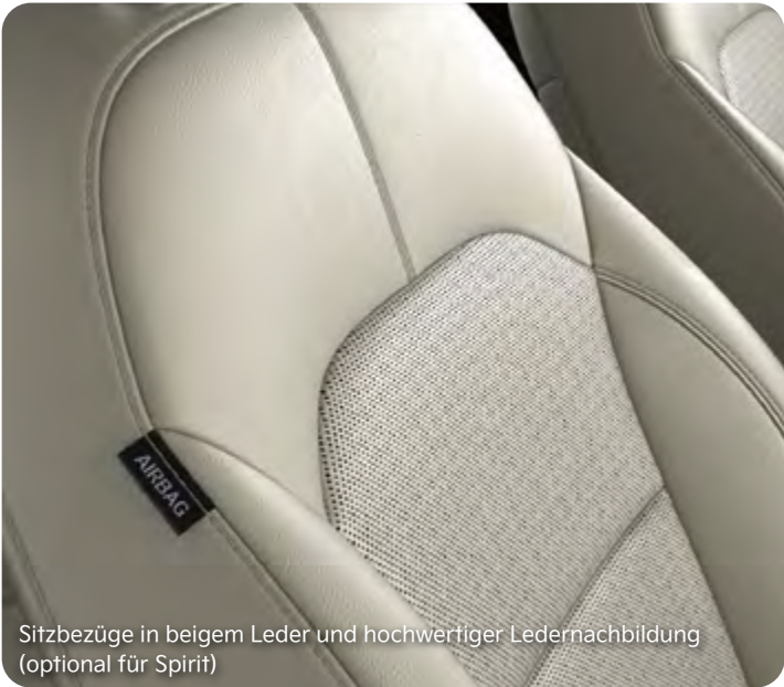
Sitzbezüge in beigem Leder und hochwertiger Ledernachbildung (optional für Spirit)