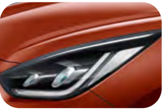
Delight Orange Metallic (DRG)

Bei einigen unserer modernen Metallicfarben werden bewusst unterschiedliche Farbpigmente verwendet. Dadurch können unter bestimmten Lichtverhältnissen, z.B. direktes Sonnenlicht, attraktive Farbeffekte erzielt werden. Zum Teil kann die Farbe changieren, z.B. von Schwarz zu Dunkelblau. Bei den hier abgebildeten Farbdarstellungen kann es aufgrund der Drucktechnik zu Abweichungen zu den Originalfarben kommen. Weitere Informationen zu den Farbeffekten und Grundfarben erhältst du bei deinem Kia-Partner. Metalliclackierungen sind aufpreispflichtig.