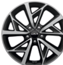
18-Zoll-Leichtmetallfelgen nur für Hybrid Spirit

Detaillierte Informationen zum Kia Niro Hybrid und Kia Niro Plug-in Hybrid findest du unter www.kia.com/de/broschuere . Dort kannst du dir auch die komplette Modellbroschüre herunterladen.