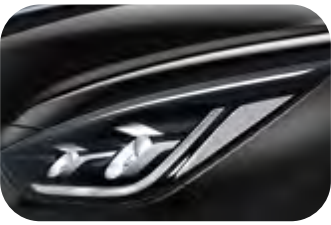
Auroraschwarz Metallic (ABP)