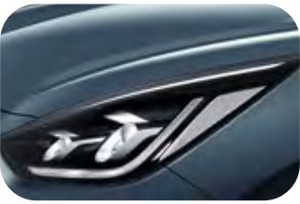
Himmelblau Metallic (BBL)