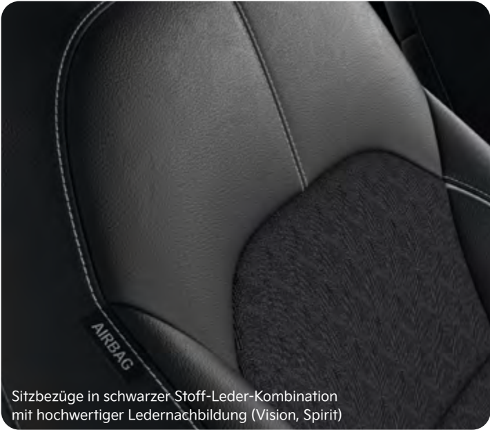
Sitzbezüge in schwarzer Stoff-Leder-Kombination mit hochwertiger Ledernachbildung (Vision, Spirit)