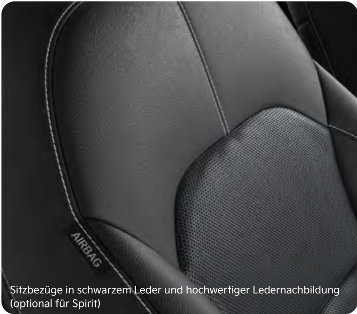
Sitzbezüge in schwarzem Leder und hochwertiger Ledernachbildung (optional für Spirit)