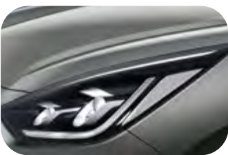
Stahlgrau Metallic (KLG)