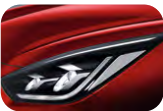
Runway Rot Metallic (CR5)