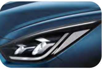
Ozeanblau Metallic (C3U)