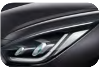
Interstellar Grau Metallic (AGT)