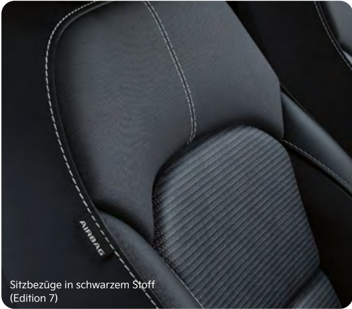
Sitzbezüge in schwarzem Stoff (Edition 7)

Im Innenraum des Kia Niro kommen sorgfältig ausgewählte Materialien zum Einsatz, damit du dich vom ersten Moment an wohlfühlst. Je nach Ausstattungsvariante stehen für die Sitze schwarze Bezüge in Stoff, Stoff-Leder-Kombination (mit hochwertiger Ledernachbildung)* oder Leder kombiniert mit hochwertiger Ledernachbildung* zur Wahl.