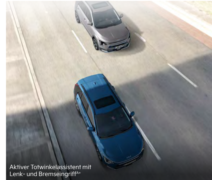
Aktiver Totwinkelassistent mit Lenk- und Bremsengriff A+

Der serienmäßige aktive Spurhalteassistent (Lane Keep Assist, LKA) behält per Kamera ständig die Fahrbahnmarkierungen im Blick. Bei einem unbeabsichtigten Verlassen der Fahrspur warnt er dich und lenkt zugleich geringfügig gegen, um das Fahrzeug in der Spur zu halten (ohne Abbildung).