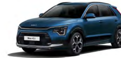
Mineralblau Metallic (M4B)