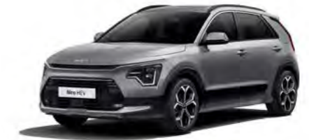
Stahlgrau Metallic (KLG)