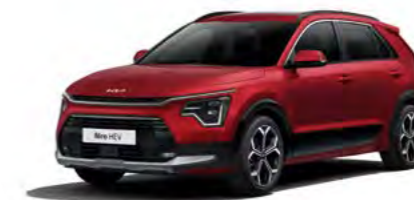
Runway Rot Metallic (CR5)

Bei einigen unserer modernen Metallicfarben werden bewusst unterschiedliche Farbpigmente verwendet. Dadurch können unter bestimmten Lichtverhältnissen, z. B. direktes Sonnenlicht, attraktive Farbeffekte erzielt werden. Zum Teil kann die Farbe changieren, z. B. von Schwarz zu Dunkelblau. Bei den hier abgebildeten Farbdarstellungen kann es aufgrund der Drucktechnik zu Abweichungen zu den Originalfarben kommen. Weitere Informationen zu den Farbeffekten und Grundfarben erhältst du bei deinem Kia-Partner. Metalliclackierungen sind aufpreispflichtig.