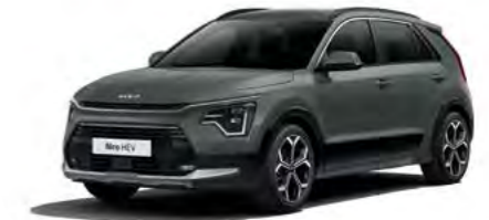
Cityscape Grün Metallic (CGE)