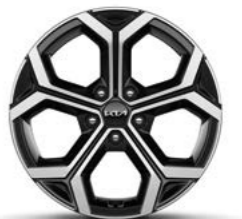
18-Zoll-Leichtmetallfelgen (optional für Spirit)

Detaillierte Informationen zum Kia Niro Hybrid und Kia Niro Plug-in Hybrid findest du unter www.kia.com/de/broschuere . Dort kannst du dir auch die komplette Modellbroschüre herunterladen.