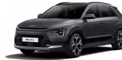
Interstellar Grau Metallic (AGT)