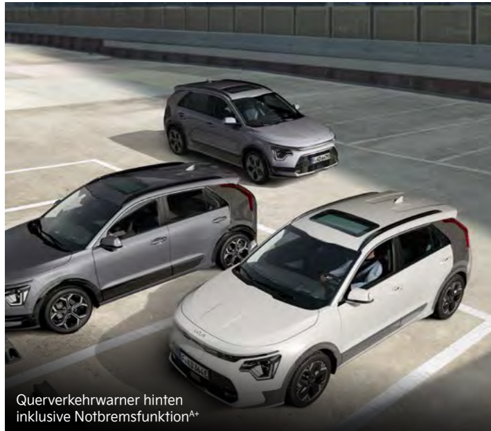
Querverkehrswarner hinten inklusive Notbremsfunktion A+

Mit einem breiten Spektrum an aktiven Sicherheitssystemen A unterstützt dich der Kia Niro dabei, in Gefahrensituationen schnell und angemessen zu reagieren.