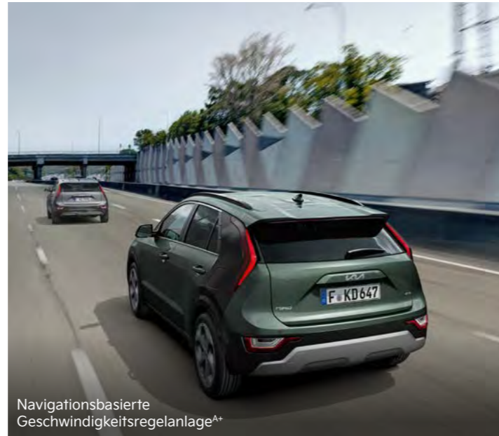
Navigationsbasierte Geschwindigkeitsregelanlage A+

Kia Niro Plug-in Hybrid: Kraftstoffverbrauch, kombiniert (l/100 km) 1,6; Stromverbrauch, kombiniert (kWh/100 km) 13,0. CO 2 -Emission, kombiniert (g/km): 36; Effizienzklasse: A+++.