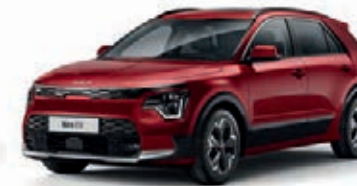
Runway Rot Metallic (CR5)