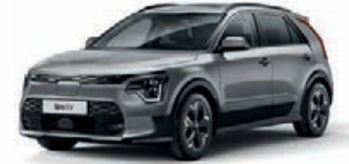
Stahlgrau Metallic (KLG)