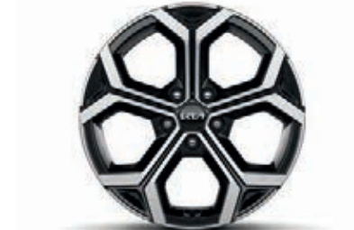
18-Zoll-Leichtmetallfelgen, nur für Spirit (Hybrid und Plug-in Hybrid)

*Verfügbarkeit abhängig von gewählter Außenfarbe.