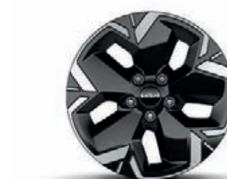
17-Zoll-Leichtmetallfelgen, nur für EV