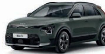
Cityscape Grün Metallic (CGE)