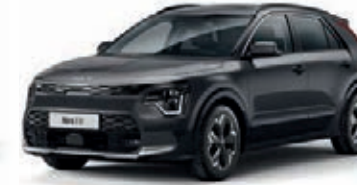
Interstellar Grau Metallic (AGT)