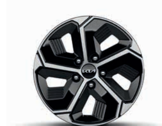
16-Zoll-Leichtmetallfelgen, serienmäßig bei Hybrid und Plug-in Hybrid