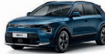
Mineralblau Metallic (M4B)