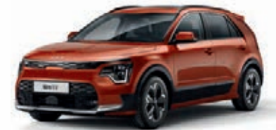
Delight Orange Metallic (DRG)