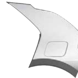
Stahlgrau Metallic (KLG), nur für EV