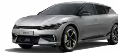
Moonscape Matt (KLM)