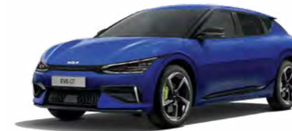
Yacht Blau Metallic (DU3)