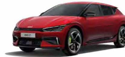
Runway Rot Metallic (CR5)

Der EV6 GT ist so individuell wie du. Passe ihn deinem Stil an. Denn jedes Detail zählt.