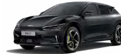
Auroraschwarz Metallic (ABP)